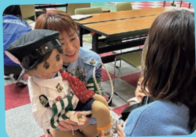
しょうちゃんも大活躍！