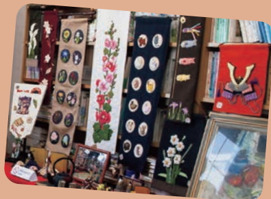
きらめきアート作品展