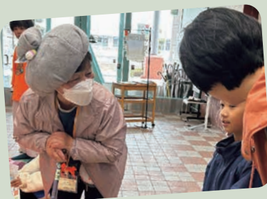
おばあちゃん、どうしたの？ (あったか声かけ体験)