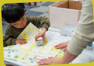
スタンプラリーに挑戦！