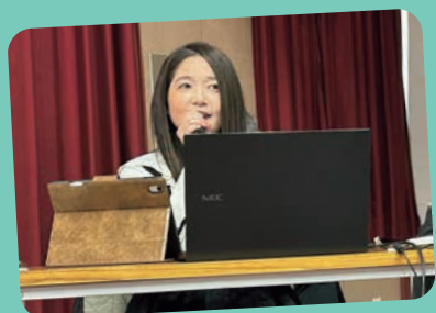
ふくし活動コンテスト