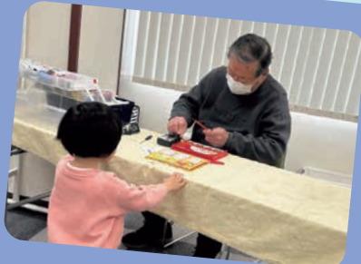
おもちゃをおるかなあ… (おもちゃの病院)