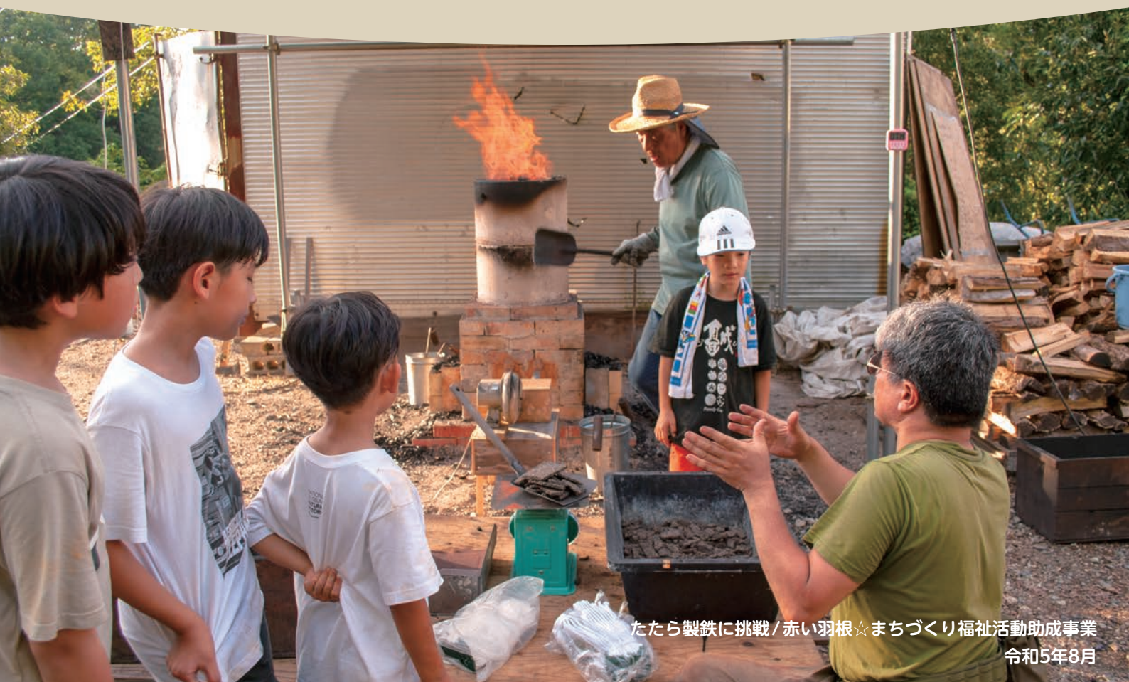
たたら製鉄に挑戦/赤い羽根☆まちづくり福祉活動助成事業 令和5年8月