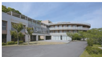
■ 牛窓地域 在宅介護支援センターAJISAI ☎ 0869-34-6368