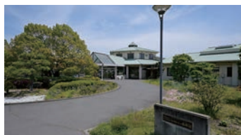
■ 長船地域 長船荘在宅介護支援センター ☎ 0869-26-4772