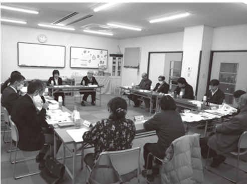
▲生活困窮者自立支援ネットワーク会議の様子(上写真)

瀬戸内市生活相談支援センターでは、市内にお住まいで生活に不安を抱えられた方、経済的に困りの方等の相談を無料でお受けしています。専門職員が相談をお聞きした上で、支援プラン(自立支援計画)の作成及び支援プランに基づく支援、情報提供、専門機関をご紹介します。